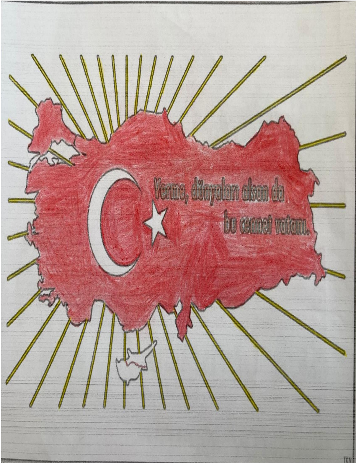
Cemile BOĞA 7/A